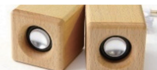
①ミニウッドタイプ (ブナのみ)