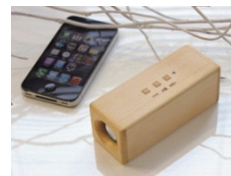
③サウンドフライタイプ (ワイヤレス) (ブナのみ)