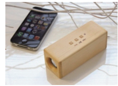
③サウンドフライタイプ (ワイヤレス) (ブナのみ)