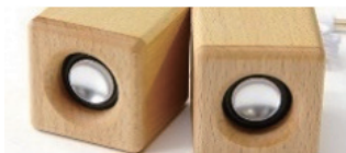
①ミニウッドタイプ (ブナのみ)